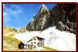
1)- Rifugio Calciati al Tribulaun/TribulaunHutte (2373 m.)

Punto di partenza: Colle Isarco/Gossensass (1110 m) cittadina che si trova 3 chilometri a nord di Vipiteno/Sterzing. All'ingresso della località, subito dopo la seconda galleria a sinistra percorrere la val di Flerese fino quasi alla fine, località Fleres di Dentro punto di partenza dell'escursione.